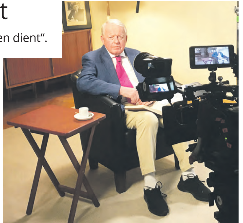
Eines der neuen Oikocredit-Testimonials: Altkanzler Franz Vranitzky