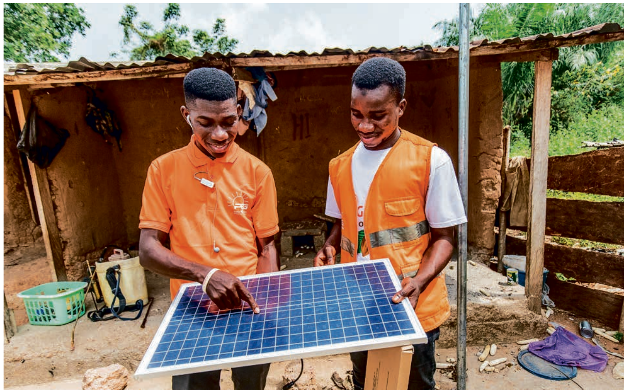
Zwei Mitarbeiter von „PEG Africa“ mit einem Solar-Panel

Seit 2016 vergibt Oikocredit deshalb Kredite an das Sozialunternehmen „PEG Africa“, das Off-