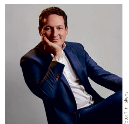
Humoriges auch zu ernsten Themen, dafür ist Eckart von Hirschhausen bekannt

Als Arzt stellte er die Diagnose „Multiorganversagen“ und stellte „unserem Wohnzimmer“, wie er unsere Erde bezeichnet, als einen Notfall hin. „Die Lunge im Amazonas wird abgeholt, der Jetstream-Kreislauf bricht zusammen, die