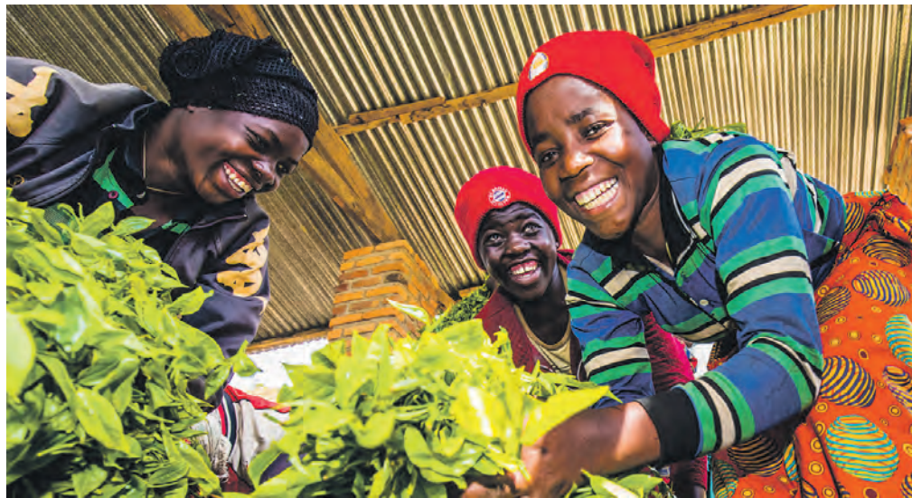
Ein Bild aus der Karongi-Teefabrik in Ruanda, einem der vielen Oikocredit-Partner

Red. Die niederländische Genossenschaftsbank, international als Sozialinvestor tätig, konnte im abgelaufenen Geschäftsjahr ihr Nettoergebnis um fast 8 % auf 14,3 Mio€ steigern. Positiv zur Entwicklung beigetragen haben unter anderem geringere Betriebskosten, höhere Margen bei Neukrediten sowie die Veräußerung von drei Kapitalbeteiligungen. Die Bilanzsumme stieg mit Jahresende von 1,29 auf 1,31 Mrd€. Insgesamt verfügte Oikocredit per 31.12.2019 über ein Investitionsvolumen von 1,271 Mrd€ (2018: 1,228 Mrd€). Die Zahl der Privatpersonen und Institutionen, die in Oikocredit investieren, nahm im Jahr 2019 um rund 2.000 auf 59.000 zu. 2018 lag der Zuwachs bei rund 1.000 Neuanlegern.